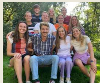
Algemeen Bestuur '23/'24